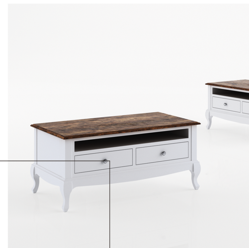
Ława kawowa 2sz

szerokość 1100 wysokość 500 głębokość 600